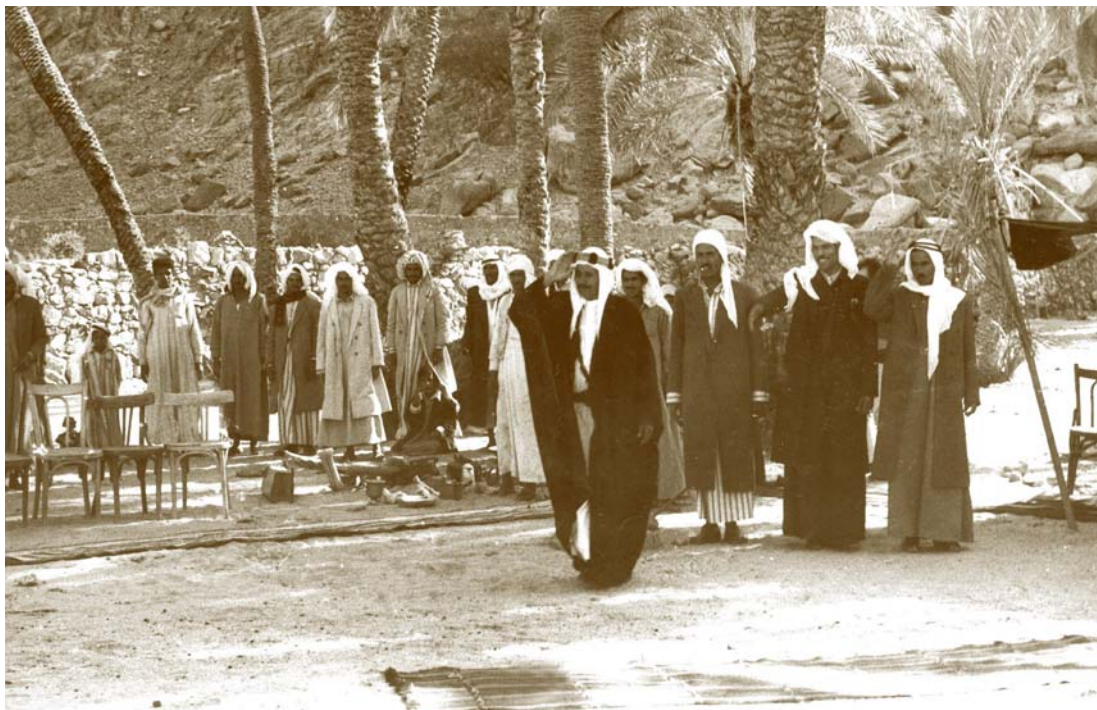
ראשי שבטים בדווים ערוכים לקבל את פניו של הנשיא שזר בנווה המדבר פארן בחצי האי סיני, 26 במרס 1969

ובמעמקי המורדות – ואדי, ודרך חול, ודרך לפני מדך מתפתלות למורד, ובמורד כמין פלטו כיכר מישור רחב ידיים. ובכיכר צומחים עצים עצי תומר ובצל עצי התומר – פגישת השייכים הערבים, ראשי שבעת השבטים לכבודנו.