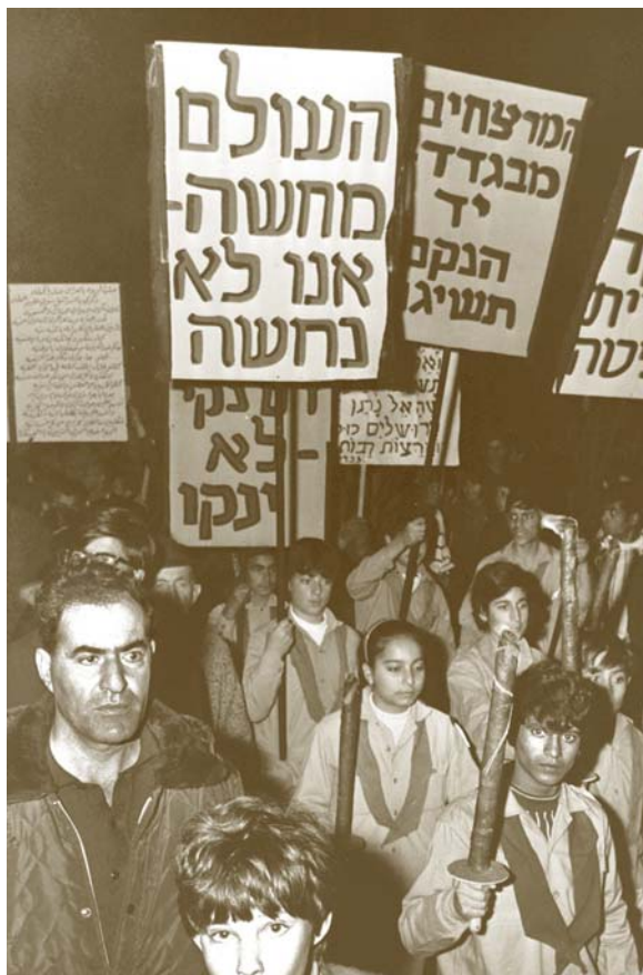
מצעד של תנועות נוער ברמת גן במחאה על הוצאתם להורג של יהודים בעיראק, 2 בפברואר 1969